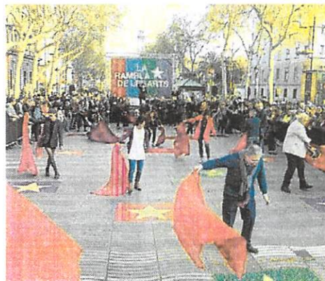
El projecte efímer de la Rambla de les Arts inaugurat ahir.

La Rambla de les Arts es va donar a conèixer durant la presentació dels actes del Dia Mundial del Teatre, que serà demà. Entre les activitats programades hi ha jornades de portes obertes en diversos teatres